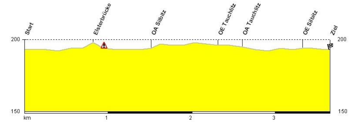
Abbildung zur 2. Etappe: